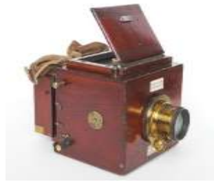
Een Mens voor de Lens