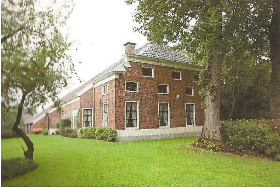
Uiterburen 45 Zuidbroek kreeg van de boerderijenstichting de Teenstraprijs.