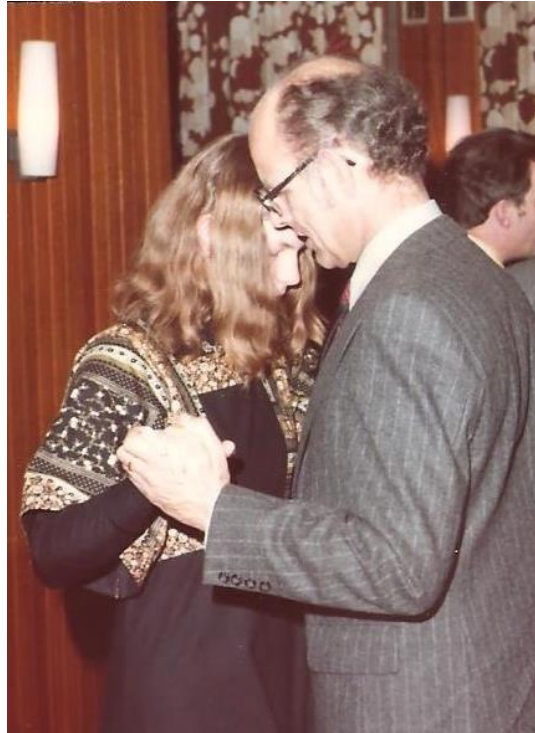
Dansen heb ik nooit geleerd, maar ik had het graag willen leren