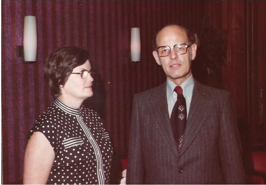
Ina gaf mij vleugels.