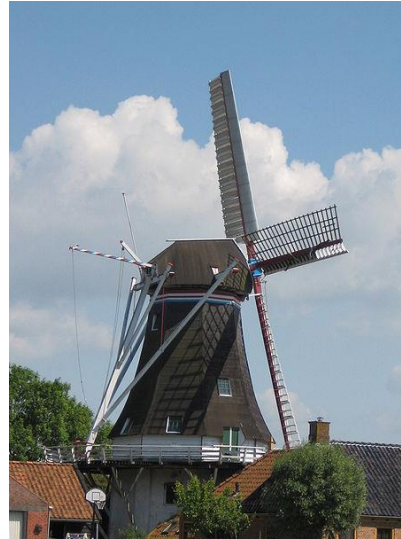
Westerwijrtwerd met links de 13 e eeuwse Mariakerk en rechts de mooie pelmolen 'Zeldenrust'