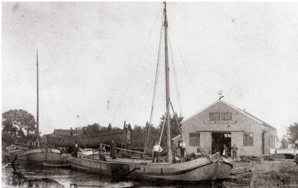
Na enkele jaren was de scheepswerf gemoderniseerd en werden er veel tjalken gebouwd