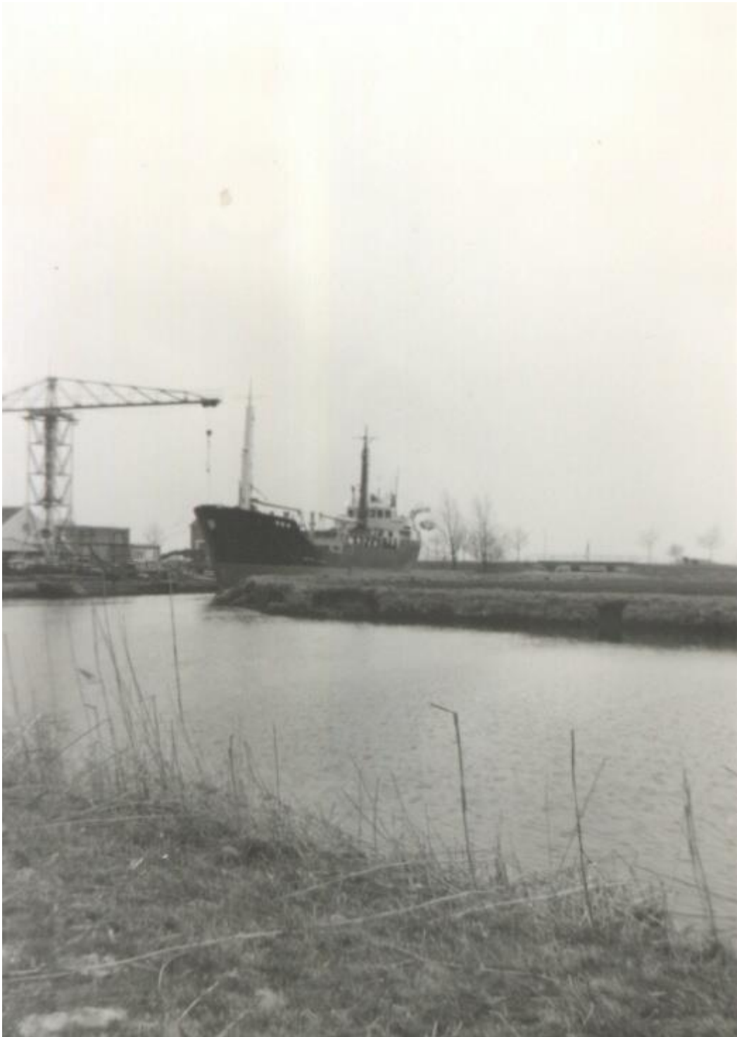
In 1966 ging de werf van Grol dicht, hier ligt het laatste schip de "GLOWE" dat op de scheepswerf werd gebouwd voor de toenmalige DDR.