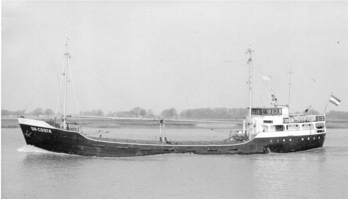
M.S Da-costa is het eerste schip dat door scheepswerf Grol op de nieuwe werf in Zuidbroek werd gebouwd