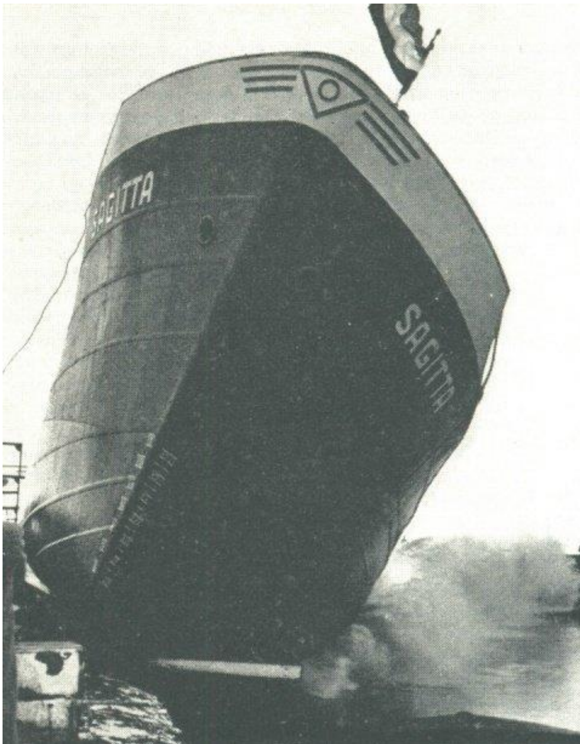
Tewaterlating van de "Sagitta" op 19 maart 1955