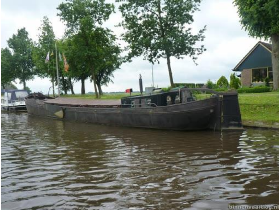
Even over internet en je komt de mooiste plaatjes tegen van door Grol gebouwde schepen. Hier de Hendrina gebouwd in 1927.