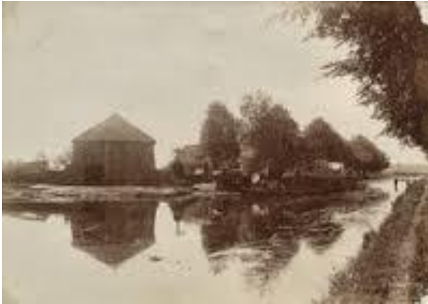
Beneden Dwarsdiep Scholthuizen te Veendam met de scheepswerf van de Gebroeders Grol. (Bij het Noordelijk Scheepvaartmuseum liggen tekeningen van Scheepswerf Grol te Veendam)