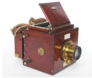
Een Mens voor de Lens