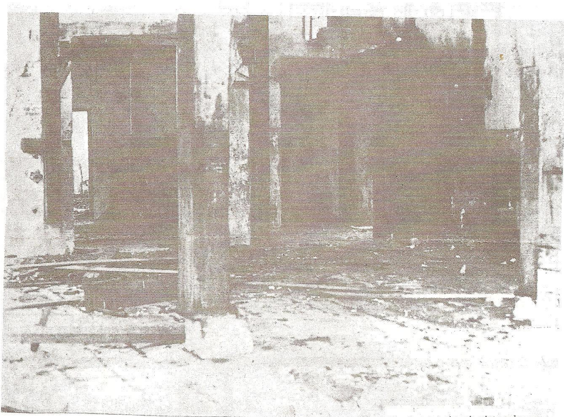
Van het interieur is niet veel over.