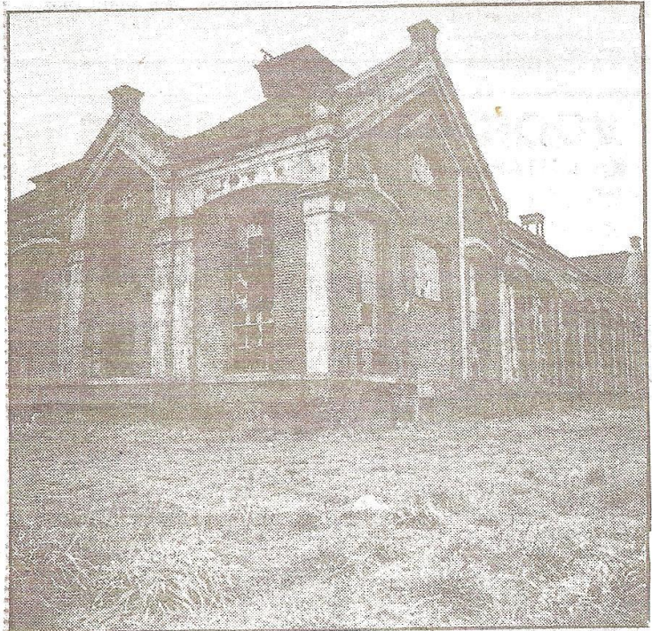
De overblijfselen van de fabriek Motké in Zuidbroek.