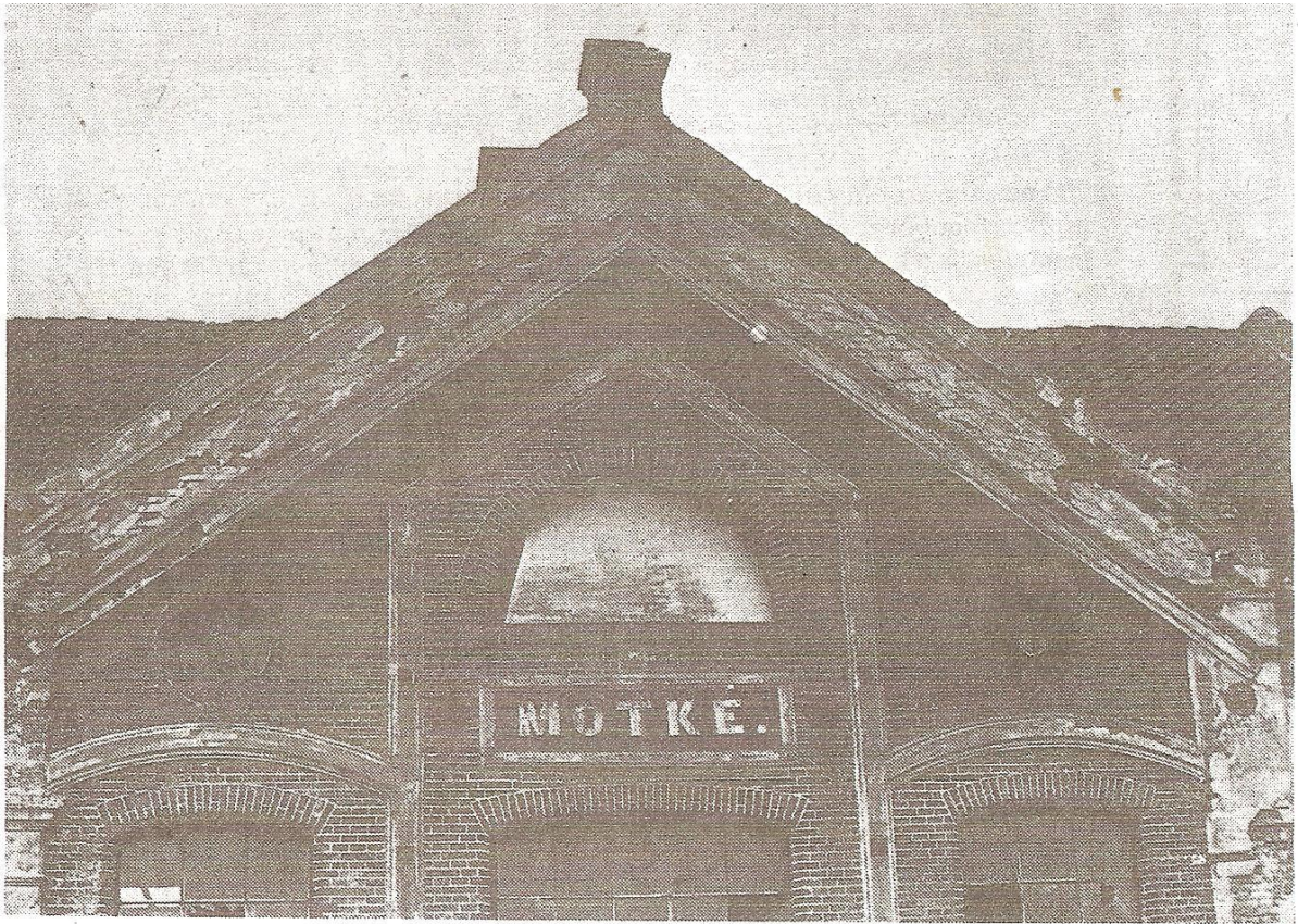
Het verval bij Mothé gaat steeds verder.